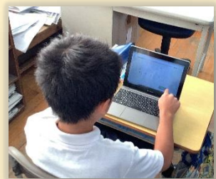
手書きで入力した“漢字”もAIが採点します