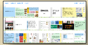
クラス全員の考えを一度に表示できます