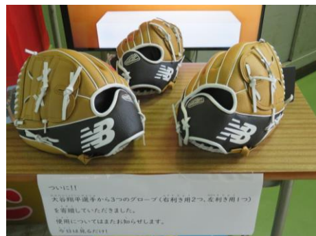
ついに!! 大谷翔平選手から3つのグローブ(右利き用2つ、左利き用1つ)を寄贈していただきました。 使用についてはまたお知らせします。 写真は見本だけ!!